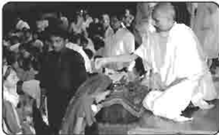
ઉપધાન તપના ઉદાર દિલ દાતા પરિવાર