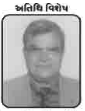
श्री लखमशीलार्ड मालशी चरला (ट्रस्टी-वागड गुडकुण) आधोई